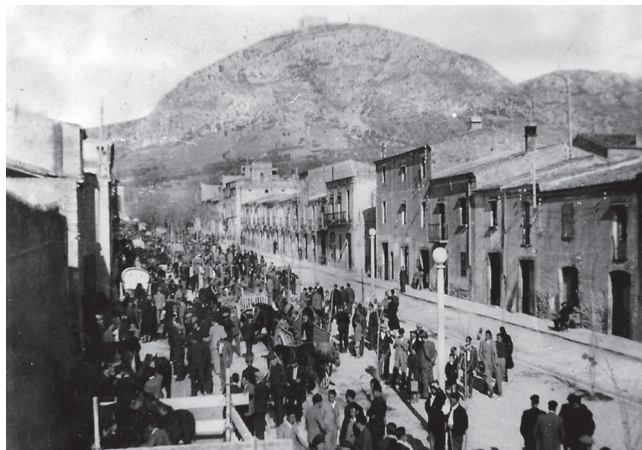
Fira de Sant Andreu al passeig de Catalunya

En la seva 23a edició, no et perdis aquesta cita ineludible amb la història i els racons de Torroella!!!